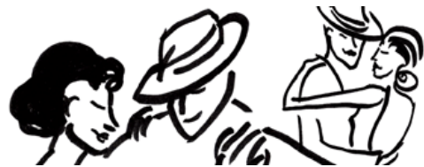
Illustration: Kirsten Nielsen

Referat fra generalforsamling i Baila el Tango den 7.9.2021 i Rosenbækhuset, Rosenbæk Torv 30, 5000 Odense.